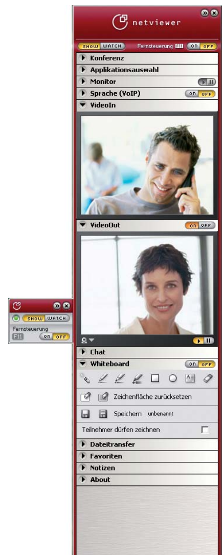
Das Netviewer Control Panel: Alle Funktionen auf einen Blick